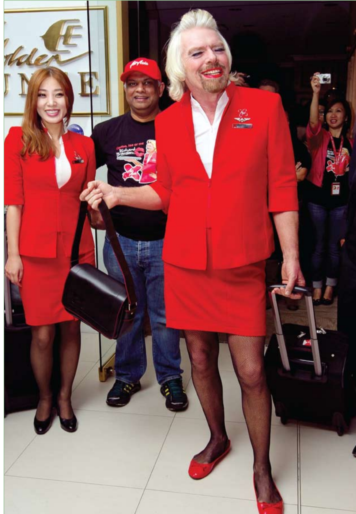
الملياردير البريطاني ريتشارد براونسون يرتدي زي مضيئة طيران ويتشم بجانب رئيس مجموعة طيران آسيا توني فرنانديز في مطار بيرث في الرحلة المتجهة الى كوالالمبور. وعمل الملياردير براونسون كمضيفة طيران طوال الرحلة بعد خسارته لرهان من فرنانديز على الفائز في سباق الفورمولا

قالت الشرطة الايطالية ان مهاجرا غانيا قتل رجلا واصاب اربعة اخرين في هجوم عشوائي على ما يبدو بعمول في مدينة ميلانو بشمال ايطاليا امس الاول وقال شهود لحطة سكاى تي جي 24 التلفزيونية ان الرجل الذي قالت تقارير وسائل الاعلام الايطالية انه موجود في ايطاليا بشكل غير قانوني هاجم المارة في منطقة سكنية بميلانو . وقتل رجل عاطل عمره 40 عاما كان في طريقه لقي على ما يبدو بعد تلقيه ضربة على رأسه وسقط على الارض حيث واصل الجاني ضربه. واصيب شخصان بجروح خطيرة في الهجوم في حين اصيب الشخصان الاخران بجروح اقل خطورة. وعرضت مشاهد تلفزيونية بقعا ضخمة من الدم على الارض وقالت وكالة الانباء الايطالية انه جي اي اول كلمات قالها الرجل للشرطة بالانجليزية انا جاني.