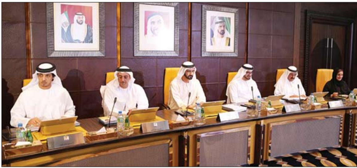
محمد بن راشد خلال ترؤسه اجتماع مجلس الوزراء (وام)

أكد صاحب السمو الشيخ محمد بن راشد آل مكتوم نائب رئيس الدولة رئيس مجلس الوزراء حاكم دبي..أن التطوير المستمر في التشريعات والنظم المالية في الحكومة الاتحادية .. يهدف بشكل أساسي للحفاظ على المال العام وتعزيز عملية المساءلة والشفافية فيما يتعلق بالإيرادات العامة للدولة إضافة إلى ترسيخ قواعد وسياسات مالية تحقق أفضل استخدام لهذه الإيرادات. جاء ذلك خلال ترؤس سموه جلسة مجلس الوزراء التي عقدت صباح امس في قصر الرئاسة.. بحضور الفريق سمو الشيخ سيف بن زايد آل نهيان نائب رئيس مجلس الوزراء وزير الداخلية وسمو الشيخ منصور بن زايد آل نهيان نائب رئيس مجلس الوزراء وزير شؤون الرئاسة. ووافق المجلس على اللائحة التنفيذية للقانون الاتحادي بشأن الإيرادات العامة للدولة.. وتهدف اللائحة التنفيذية الجديدة للقانون رقم 1 لسنة 2011 بشأن الإيرادات العامة للدولة إلى تنسيق السياسات المالية ورفع كفاءة التشريعات والنظم المالية بما يحقق دعم الميزانية العامة للدولة وتحديد الحقوق والصلاحيات للجهات في مجال تحصيل الإيرادات والرسوم. (التفاصيل ص2)