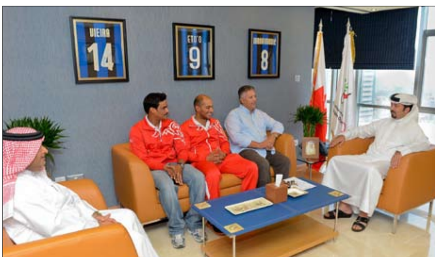
لشريف المملكة خير تشريف في مختلف المحافل الخارجية.